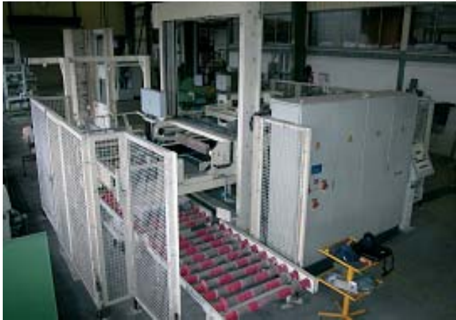
Low level Sackpalettierer